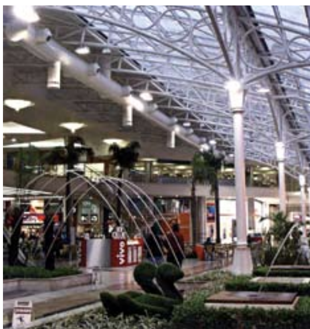
Estação Embratel Shopping e Centro de Convenção, Curitiba, Brasil