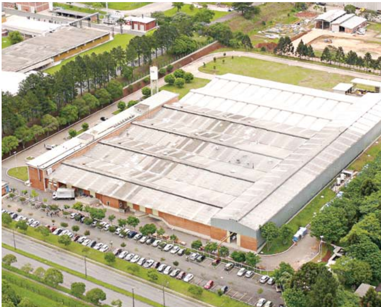
Vista aérea da fábrica em Curitiba, Paraná