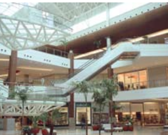
Salvador Shopping, Salvador (BA)