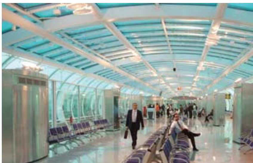
Aeroporto Santos Dumont, Rio de Janeiro (RJ)