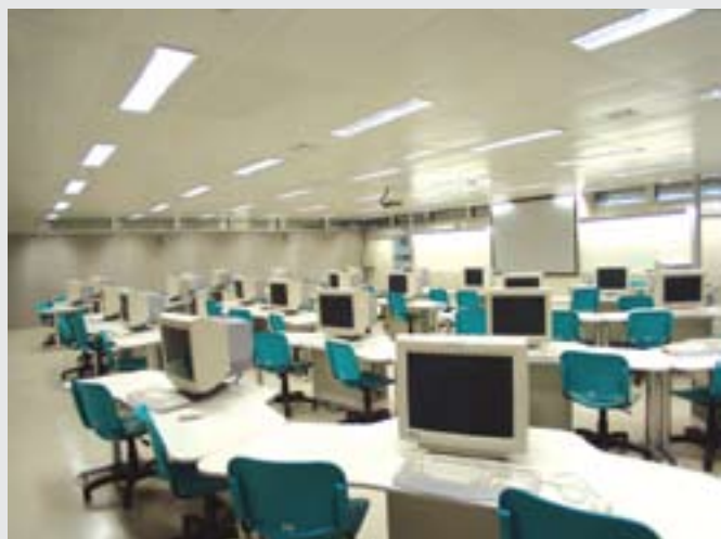
Laboratório da Escola Politécnica da USP, São Paulo (SP)