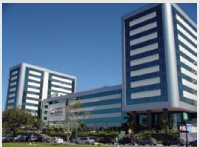
Hospital da Bahia, Salvador (BA)