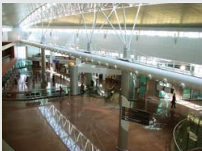
Aeroporto Internacional Zumbi do Palmares, Maceio (AL)