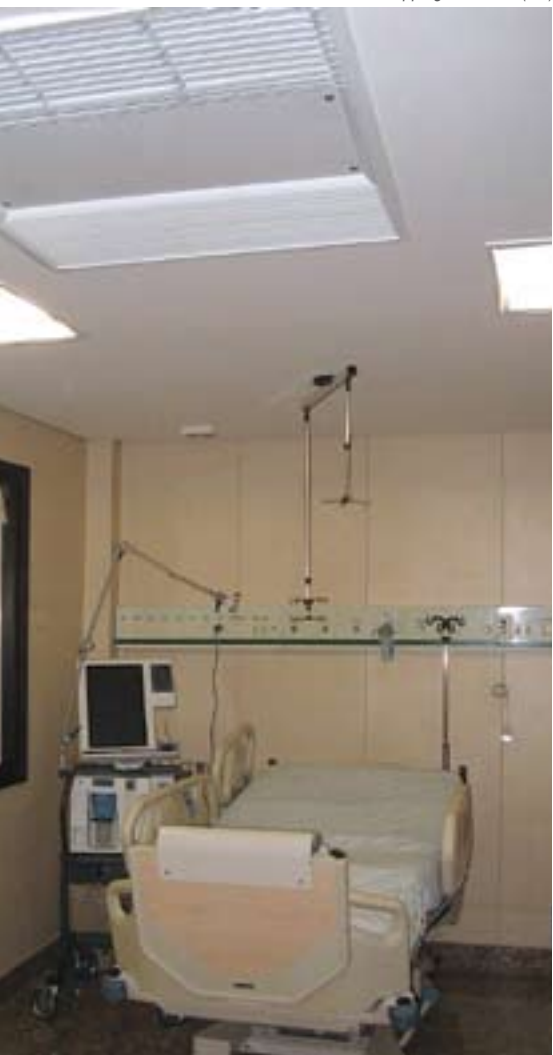
Hospital Mater Dei, Belo Horizonte (MG)