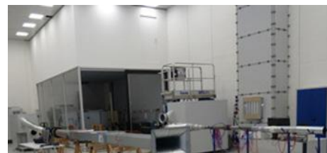
INSTALAÇÕES DE TESTE TECNOLOGIA DE CONTROLE