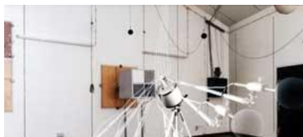
EDIÇÕES EM ATENUADORES DE SONO ACÚSTICA