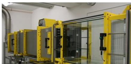
PARA MAIS ALTAS DEMANDAS TECNOLOGIA DE FILTRAGEM