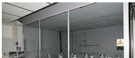
INSTALAÇÕES DE TESTE TECNOLOGIA DE DISTRIBUIÇÃO DE AR