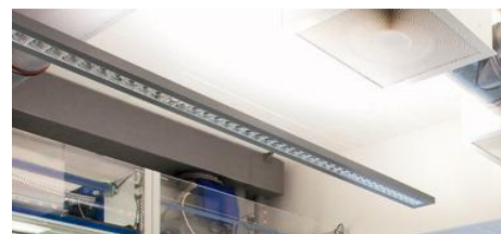
LABORATÓRIO TECNOLÓGICO SALA DE DEMONSTRAÇÃO