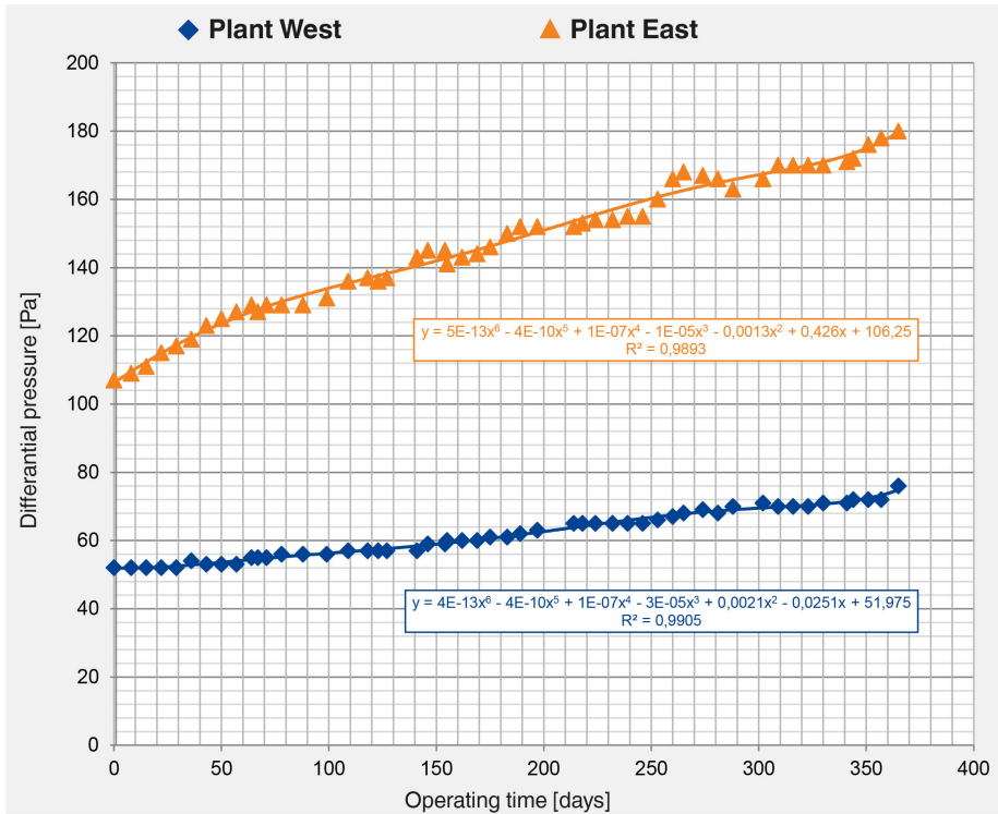
Fig. 1: Graph showing all recorded measurement data

Era então necessário determinar a quantidade de energia necessária para que cada sistema superasse a pressão diferencial - ou, por outras palavras, para que o ar passasse através dos filtros. Utilizando uma fórmula que inter-relaciona o débito volúmico, o tempo de funcionamento e a eficiência do ventilador, é possível calcular a quantidade de energia necessária para cada metro cúbico de ar deslocado. O resultado: durante o tempo de funcionamento, o filtro de bolsas NanoWave® necessitou de cerca de 0,3 kWh/a para cada m 3 /h de débito volumétrico de funcionamento. O filtro sintético consumia 0,71 kWh/a. Isto significa que o filtro NanoWave® da TROX é cerca de 58% mais eficiente.